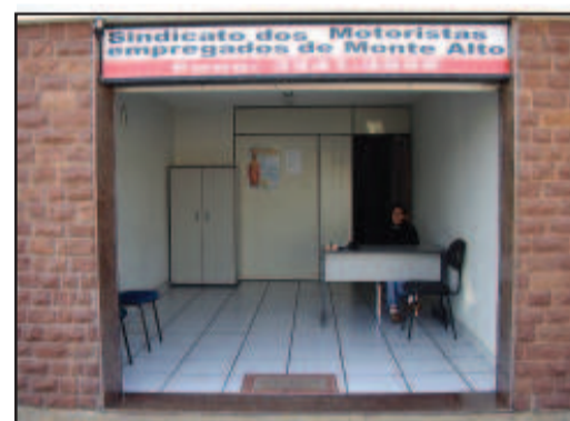
Sede do Sindicato dos Motoristas em Monte Alto