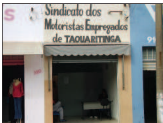
Sede do Sindicato dos Motoristas em Taquaritinga