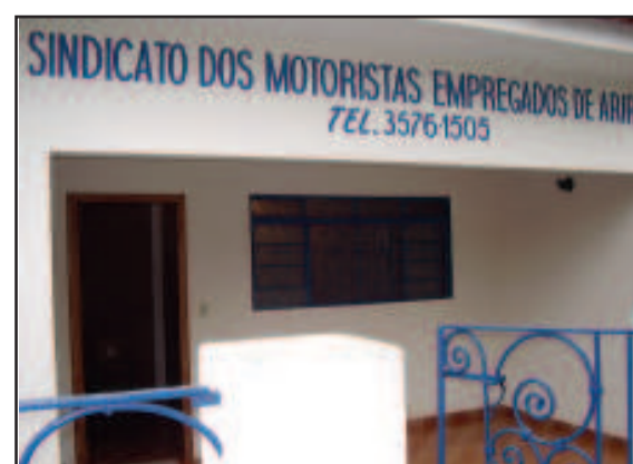
Sede do Sindicato dos Motoristas em Ariranha