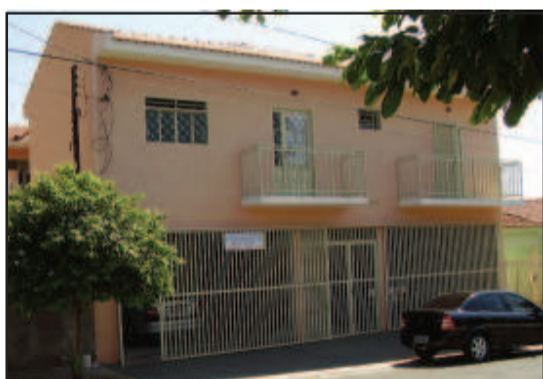
Sede do Sindicato dos Motoristas em Santa Adélia