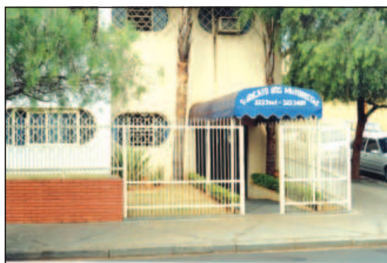
Sede do Sindicato dos Motoristas em Jaboticabal

Há muitos anos, o Sindicato dos Trabalhadores Rodoviários de Jaboticabal trabalha para firmar convênios e parcerias que beneficiem todos os filiados. Seja na sede em Jaboticabal ou nas subsedes de Santa Adélia, Monte Alto, Taquaritinga ou Ariranha, tudo tem sido feito a fim de, além de lutar pelos direitos da categoria, firmar acordos que promovam o bem-estar de todos os sindicalizados. Nesta edição, você confere quais os benefícios disponibilizados em cada uma das sedes e subsedes do sindicato na região.