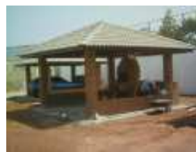
Quiósques para churrasco