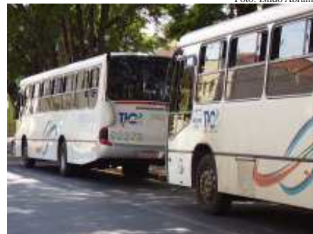
Ônibus da Viação Piracema estacionados próximo a Praça Joaquim Batista