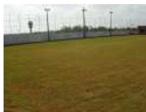
Campo de futebol