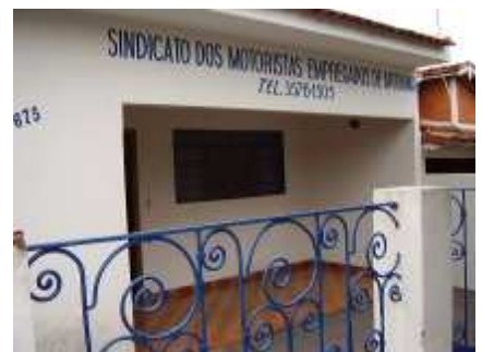
Fachada do prédio da sub sede de Ariranha

SUB SEDE EM ARIRANHA RUA BARÃO DO RIO BRANCO, 675 FONE: (17) 3576.1505